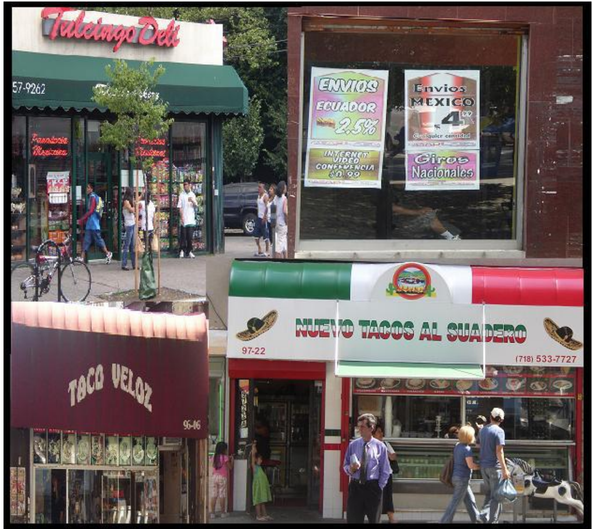
Figura 5. Fotos tomadas por la autora en la calle Roosevelt, Queens.

Según Nicholas De Genova (2005), existe una racialización en los espacios en que habitan y desarrollan su vida los mexicanos en los Estados Unidos. En su trabajo Working the Boundaries: race, space and "illegality" in Mexican Chicago , desarrolla una etnografía sobre la vida y los trabajos de los mexicanos que habitan en Chicago. En sus conclusiones, afirma que la racialización de los espacios, la subordinación y formación de clase, está basada en las políticas de nativismo y ciudadanía de los Estados Unidos. Así las leyes migratorias y políticas migratorias han trabajado a través del tiempo para construir una idea sobre el mexicano como el "illegal alien" como una constante amenaza para el sistema. Estas ideas a su vez se ven reforzadas con las amenazas de la deportación, lo que mantiene