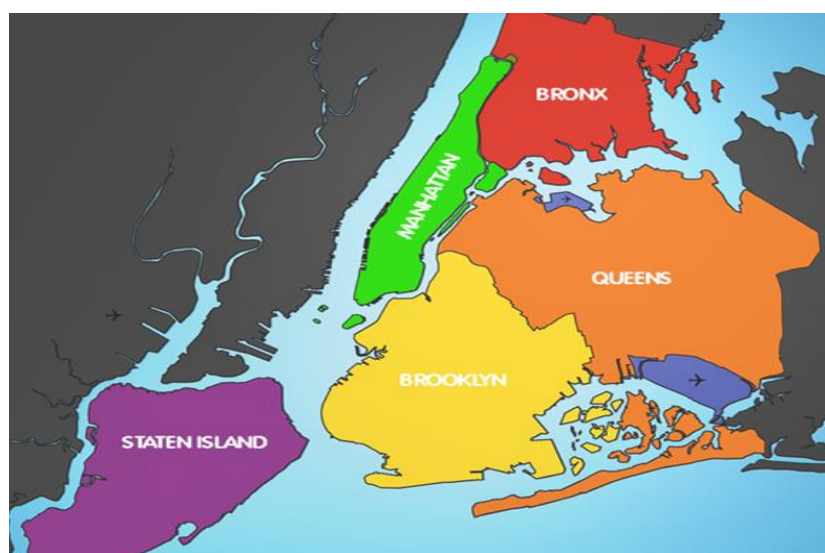
Figura 3. Mapa de la ciudad de Nueva York. Principales distritos. www.newyorkando.com 620x604

Otro de los lugares en donde se ha incrementado la presencia de hispanos como colombianos, ecuatorianos y mexicanos, es Jackson Heights, Queens. Calles como la Roosevelt o la Corona se han convertido en espacios de referencia para la mayoría de los mexicanos. En estas calles podemos observar una enorme cantidad de tiendas de abarrotes, en las que es posible encontrar tortillas de maíz, mole poblano, restaurantes de comida mexicana o ecuatoriana, servicios de mensajería, centros de money orders o envío de dinero, venta de películas y música mexicana, medallas de la virgen de Guadalupe, camisas vaqueras, oficinas de abogados que ofrecen sus servicios para problemas migratorios, herbolarias, videgrabación de fiestas y eventos, es decir, toda una serie de mercancías, productos y servicios, orientados al mercado latinoamericano.