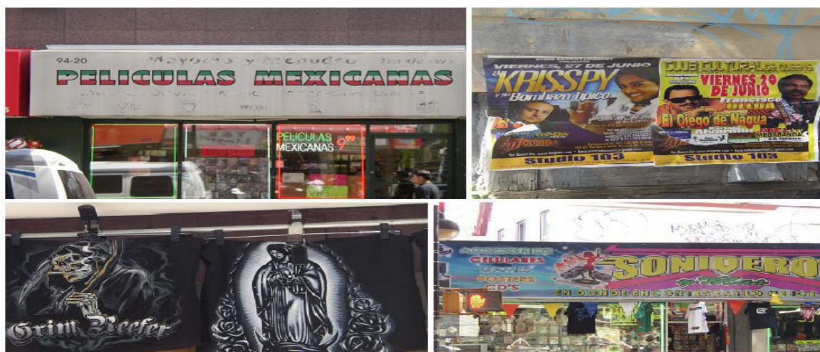
Figura 4. Fotografía calle Roosevelt, Queens tomada por la autora.

Muchas de las familias entrevistadas han pasado la mayor parte de sus vidas entre su hogar y la calle Roosevelt en Jackson Heights . Estos barrios —o pequeñas áreas aglutinantes— llegan a convertirse en los únicos espacios de interacción de los mexicanos, ya que no se sienten intimidados como en otras áreas de Nueva York, tales como “el blanco Manhattan”. La vida social se desarrolla en salones para fiestas en el área de Queens y los restaurantes mexicanos a los que llegan a ir en algún día festivo. Una mujer que lleva viviendo diez años en Nueva York, procedente de una comunidad rural de Puebla, me comentó una de sus impresiones a su llegada que ejemplifica lo anterior: “ cuando llegué a Nueva York pensé que vería muchos güeros, pero solamente encontré puro moreno y mexicano como en mi pueblo, entonces así qué chiste. ”