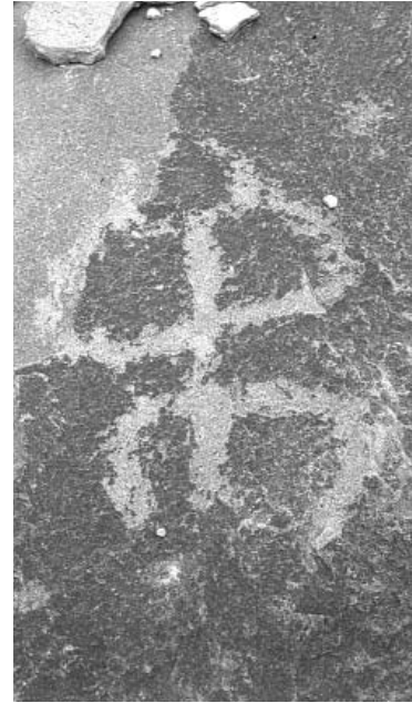
Petrograbado "El Barril", municipio de Ramos Arizpe, Coahuila

El segundo mapa, basado en Aurea Commons (1993), se refiere a las regiones políticas de la Colonia entre 1534 y 1776, y será fácil ubicar a la Nueva Vizcaya, la Nueva Santander, la provincia de Coahuila y al Nuevo Reino de León mencionados en el artículo de Sheridan, donde también se suceden los hechos principales mencionados por Deeds. Asimismo podemos identificar la Provincia de Sonora, donde se ubica el trabajo de Radding.