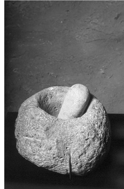
Mortero. Museo de Desierto, Saltillo