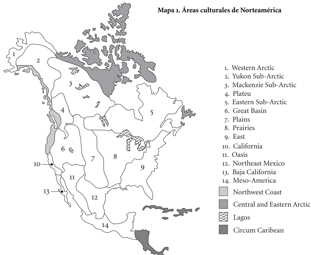
Mapa 1. Áreas culturales de Norteamérica