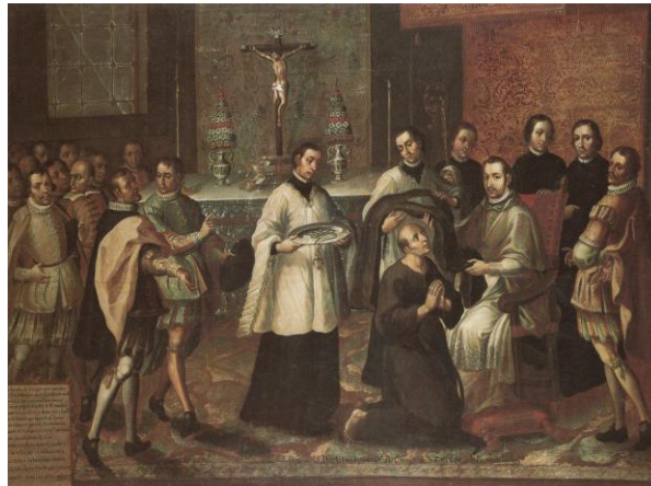
Hospital de San Juan de Dios, Atlixco, Puebla

De los ejemplos anteriores se desprende que la figura del venerable se consideraba digna de devoción y de ser reconocido como santo. Destacan sus atributos como místico, asceta, regulador, político y reformador de los vicios de eclesiásticos y civiles. La manipulación del discurso visual, sin duda apunta a transgredir las normativas oficiales que impedían un culto no sancionado que rayaba en la heterodoxia y que era accesible, tanto a minorías cultas como a la población en general. Pues, mientras los primeros podían acceder a los significados del lenguaje alegórico y emblemático, los segundos eran partícipes de la vigencia de una memoria y de una representación que se negaba a olvidar una figura a la que podían considerar propia de la configuración social y religiosa de su ciudad y de sus necesidades. Ambos son muestras de los recursos -los medios mnemónicos- a los que acuden los grupos sociales, para preservar figuras útiles para la transmisión de mensajes políticos.