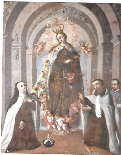
Convento de la Soledad, Puebla

La alusión a san Ambrosio se repite en otro cuadro que se ubica en el Santuario de Nuestra Señora de la Luz (Figura 5). La obra que data del siglo XVIII forma parte de una serie donde aparecen de forma individual los cuatro doctores de la Iglesia: Gregorio, Agustín, Jerónimo y Ambrosio. Este último, con algunas de las facciones de Palafox aún más disimuladas, escribe en una mesa, junto a una mitra episcopal y a librerías llenas de volúmenes con títulos ilegibles (elementos que corresponden además con las representaciones de Palafox como hombre ilustrado). La interpretación iconográfica tiene que ver con la amplia obra escrita del venerable, con la sabiduría y con su misión reformista que se asocia con el legado de Ambrosio de la patrística y consolidación del poder de la Iglesia. 616