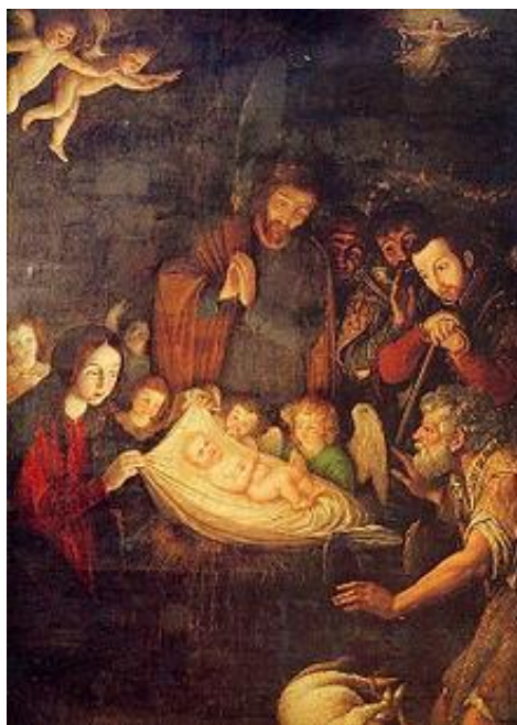
Retablo de la Capilla de los Reyes, Catedral de Puebla