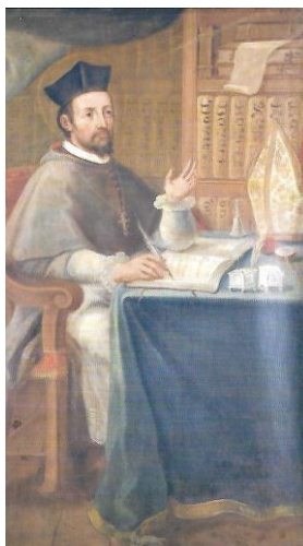
Santuario de Nuestra Señora de la Luz, Puebla

Existe otra obra “Adoración de la eucaristía” de José de Ibarra fechada en 1732 que se ubica en la Catedral de Puebla en espacio visible y accesible (Figura 6). En ella el Espíritu Santo, descendiendo de la gloria, se posa sobre la hostia consagrada y el cáliz. La escena es venerada por varios ángeles que vuelan y ocho hombres que visten como canónigos de la Catedral, que representan a varios santos coronados con sus nombres (Lorenzo Justiniano, Gregorio, entre ellos). El único que observa al espectador -el único que no está canonizado- con las tradicionales facciones de Palafox, se corona como Pedro de Osma (S. Pedro Oxomensis, sic ), fundador de la diócesis cuya sede ocupó el venerable, los últimos años de su vida. 617