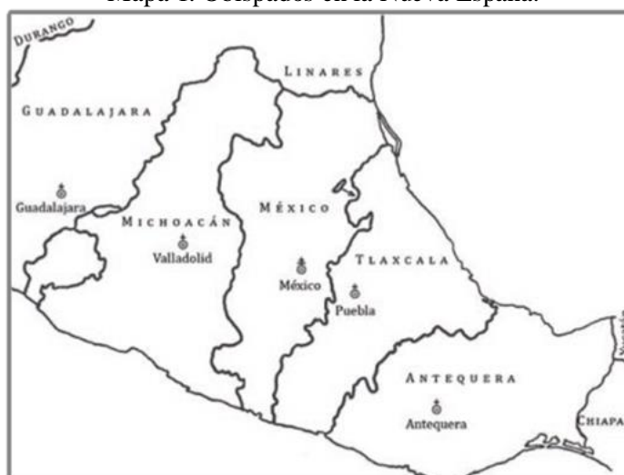
Mapa 1. Obispados en la Nueva España.