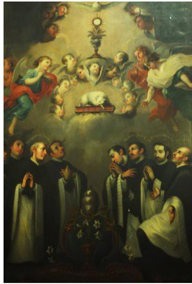
Catedral de Puebla