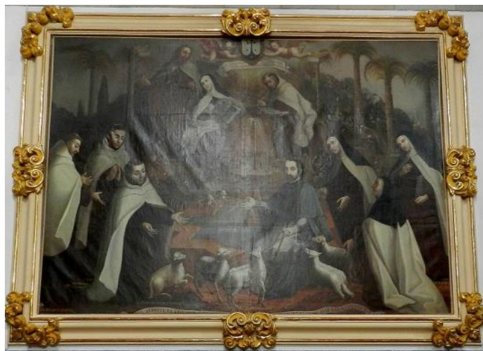
Templo del exconvento del Carmen, Puebla

A lo largo del siglo XVIII, los carmelitas continuaron desempeñándose como promotores de la beatificación frente al poder de los jesuitas que habían logrado suspender la causa en 1699. Con el transcurrir de los años, la imagen de Palafox se politizó cada vez para crear distintas recuperaciones. Sin lugar a duda, destaca el uso que de su impronta hizo el regalismo español, particularmente el borbón Carlos III. El rey, apelando a intereses estrictamente políticos, recuperó la polémica figura del prelado para fortalecer la narrativa de una monarquía poderosa y centralizada que requería supeditar a todos los actores del sistema imperial, incluidos los jesuitas.