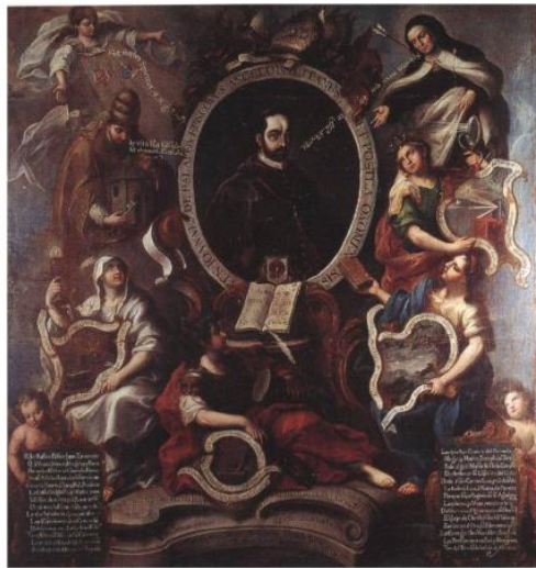
Figura 8. Retrato del venerable Juan de Palafox y Mendoza . Miguel Cabrera, 1765

Museo de Arte Colonial, Morelia, Michoacán