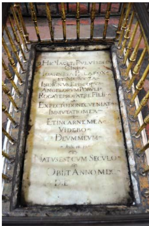
Catedral de Puebla, altar del perdón.